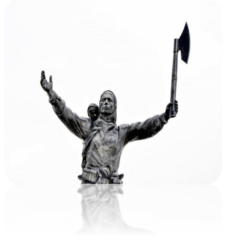
Nene Hatun'un Erzurum Aziziye Parkı'na dikilen heykeli

Cepheye mühimmat taşıyan, askerlere hemşirelik, açılık ve sakalık yapan Nene Hatun, Erzurum'dan sonra tüm Anadolu'da da destanlaştı.